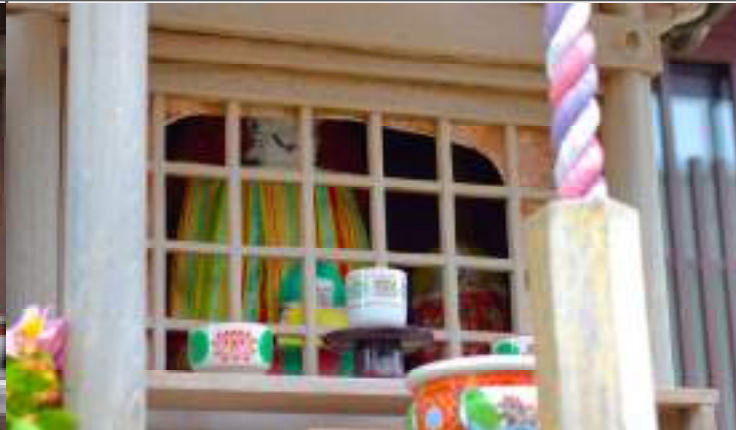
エントリ＝ NO2 (文殊地藏)