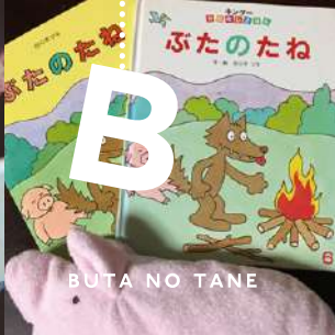
BUTA NO TANE