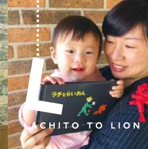
RACHITO TO LION

のねずみのぐりとぐらは、双子の兄弟。巨大な卵を森で見つけ大きなカステラを作ります。このよで一番すきなのはお料理する事。食べる事。ぐりとぐら～このリズムを我家では何度も合唱しました。作者のお二人も姉妹。55年前子供達に美味しい物をご馳走しようと絵本に書いたそうです。