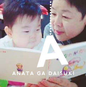
ANATA GA DAISUKI