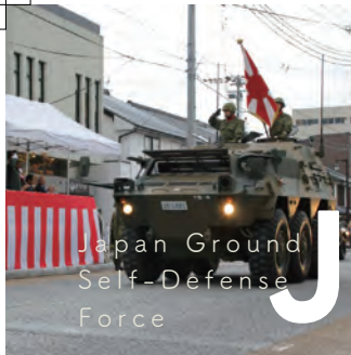
Japan Ground Self-Defense Force