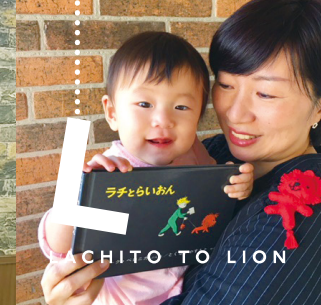
CHITO TO LION

のねずみのぐりとぐらは、双子の兄弟。巨大な卵を森で見つけ大きなカステラを作ります。このよで一番すきなのはお料理する事。食べる事。ぐりとぐら～このリズムを我家では何度も合唱しました。作者のお二人も姉妹。55年前子供達に美味しい物をご馳走しようと絵本に書いたそうです。