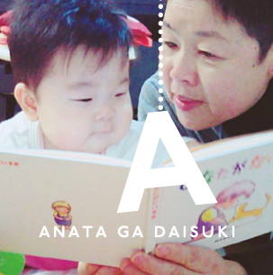
ANATA GA DAISUKI