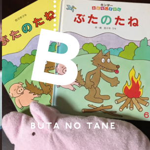
BUTA NO TANE