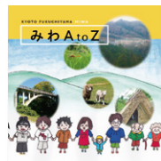
「みわAtoZ」ができるまで